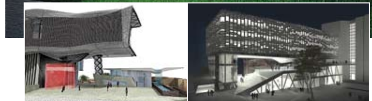
מקום שלישי: קימל אשכולות אדריכלים | מקום שני: באה אדריכלים בונה ערים

3. ▶ משרד האדריכלים אמיר מן-עמי שנער נבחר לתכנן את קמפוס שנקר ובניין בית הספר למוסמכים ע"ש דוד עזריאלי. קדמה לבחירה תחרות שנערכה בשיתוף עמותת האדריכלים, ובה השתתפו תשעה משרדי אדריכלים. במקום השני זכו באה אדריכלים בונה ערים, ובמקום השלישי קימל אשכולות אדריכלים. בחבר השופטים נמנו מוחמי ארכיטקטורה, בהם: פרופ' רוברט אוקסמן, יו"ר ועדת הקמפוס, האדריכל דוד עזריאלי, אדריכל חיים כהן, מהנדס העיר רמת גן, האמן דני קרוון, פסל סביבתי, אדריכל גדעון שריג, אדריכל גידי פובזנר, נציג עמותת האדריכלים, אדריכל צבי ליסר, נציג עמותת האדריכלים, אדריכל אריה גונן, מזכיר התחרות. תערוכה שתציג את כל העבודות שוגשו לתחרות תיפתח באירוע הגיגי ב-3 ביולי. נעילה: 24 ביולי. בית האדריכל, המגדלור 15, יפו, 03-5188234.