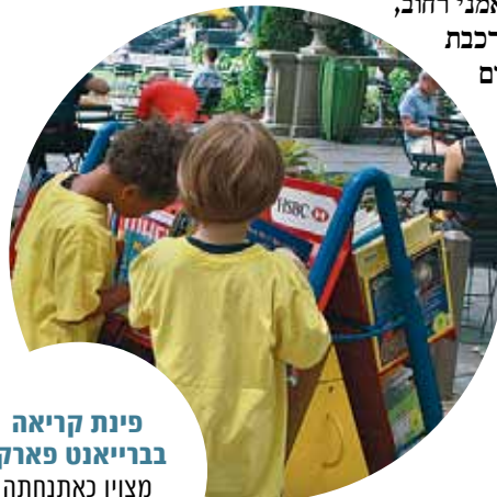
פינת קריאה בבריאות פארק. מצוין כאתנתה

קייץ הוא קייץ גם בעיר המסעירה בעולם. הטמפרטורות מטפטפות פה לפעמים ל-36 מעלות והאוויר נמלא באדי מים. אבל אז מגיע משב מרענן ממנהרת רוח מגרדת שחקים, העין נתקלת בחבורה צבעונית של אמני רחוב, והרגליים מוליכות אל הרכבת התחתית הממוזגת. פתאום החום נעשה הרבה יותר נוח. כיעד לטיול עם ילדים, יתרונה של העיר הוא בכך שההיצע שלה כה מסחרר, עד שבנקל ניתן להרכיב רשימת פעילויות שתכסה את גילאי תשעה חודשים עד 99, ולשלב בין הצרכים של כולם.