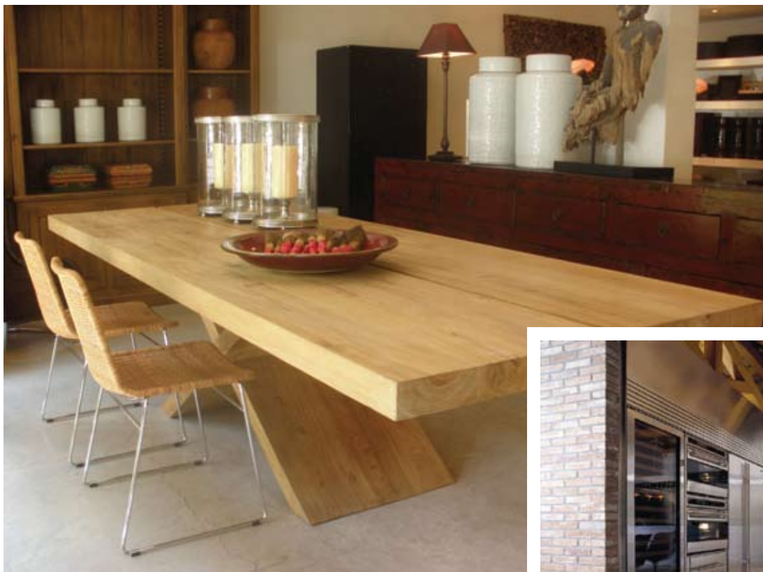
לופט צילום: יח"צ