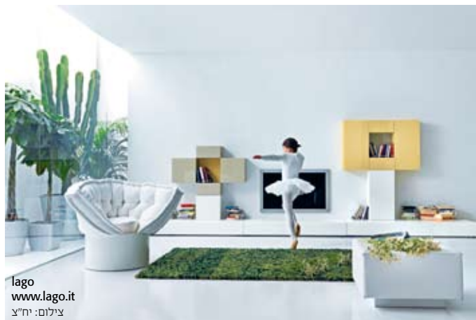
lago www.lago.it