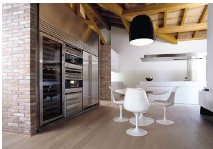
סאב זירו